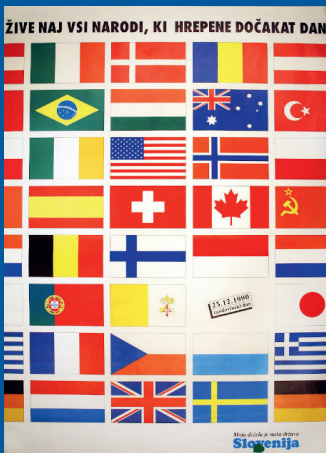
Uradni plakat iz medijske kampanje v podporo plebiscitu. (Avtor: Jure Apih in Futura d. o. a. Zbirka plakatov, letakov in transparentov Muzeja novejšje zgodovine Slovenije.)