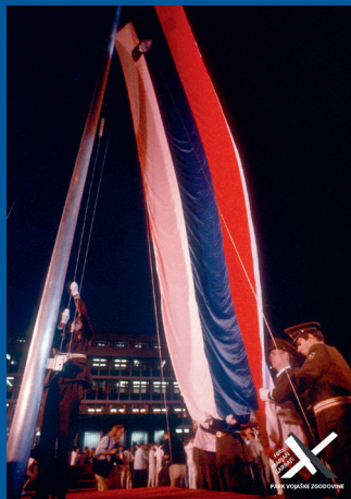
Razglasitev samostojnosti na Trgu republike 26.6.1991.

Skupščina RS je 25. junija 1991 sprejela temeljne osamosvojitvene zakone in razglasila državno samostojnost Republike Slovenije. Slovesna razglasitev je potekala 26. junija, ko je bila prvič javno razobešena nova slovenska zastava.